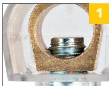
латунная контактная группа